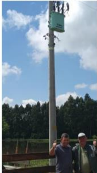
Figura 2: Programa de eletrificação rural

Foram encaminhados à concessionário de energia elétrica 19 projetos de ampliação de eletrificação rural.