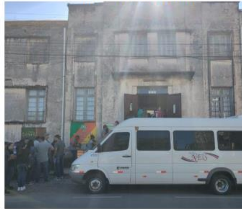
Figura 6: Alunos junto ao transporte em Caxias do Sul