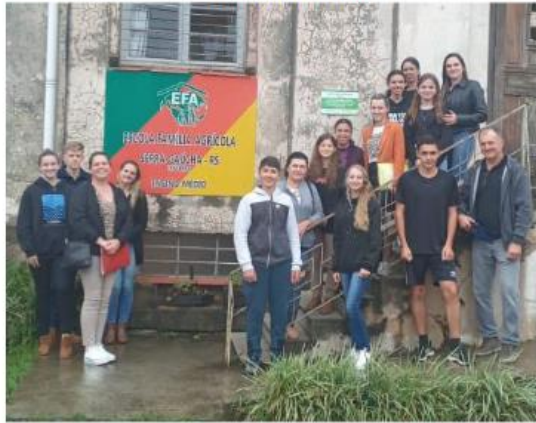
Figura 5: Alunos em frente a EFASERRA

Acompanhamento e transporte de 09 novos alunos para EFA, Escola Família Agrícola de Caxias do Sul. Além dos 10 alunos dos demais anos.