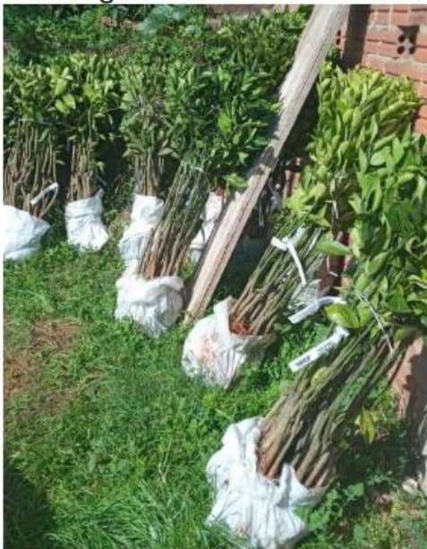
Figura 7: Mudanças de citrus

Distribuição 2.285 mudas de citrus (Laranja Valência, Seleta e Umbigo, Bergamota Montenegrina, Ponkã e Caí e Limão Taiti).