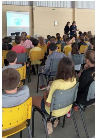
Figura 20: Palestra de educação ambiental nas escolas