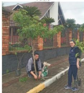
Figura 9: Plantio de árvores nativas nas ruas

Aquisição de 80 mudas nativas para arborização urbana: Rua Alberto Neis, Avenida da Emancipação, Oscar Aloysio Führ, Pedro Kolling, Rua Pedro Führ e Rua Antônio Leopoldo Ritter, além da distribuição de 26 mudas para plantio no pátio das escolas.