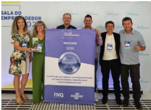
Figura 21: Recebimento do selo Diamante

Capacitação sobre compras governamentais, Nova Lei de Licitações, Sala do Empreendedor, Captação de recursos e gestão municipal aos servidores da Prefeitura Municipal através do Programa Cidade Empreendedora do Sebrae.