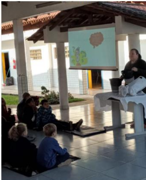
Figura 19: Educação ambiental nas escolas