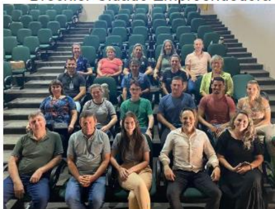
Figura 26: Palestra do Programa Brochier Cidade Empreendedora