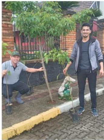
Figura 11: Plantio de árvores nativas nas ruas

Prefeitura Municipal de Brochier CNPJ/MF: 91.693.309/0001-60 Rua Guilherme Hartmann, 260 – CEP: 95.790-000 Fone: 51 – 36971215 – Fax: 51 - 36971218 e-mail: fazenda@brochier-rs.gov.br // site: http://www.brochier.rs.gov.br/