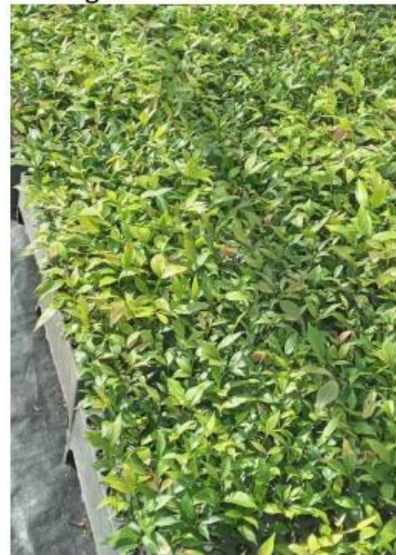
Figura 8: Mudanças de citrus