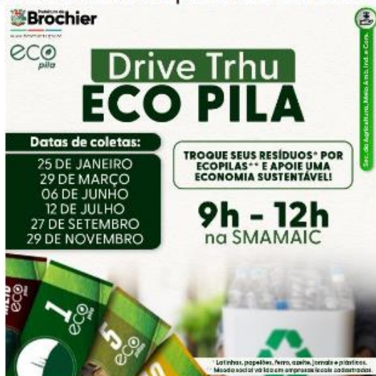
Figura 14: Previsão de datas para o recolhimento dos resíduos

Foram realizadas 07 campanhas de descarte correto.