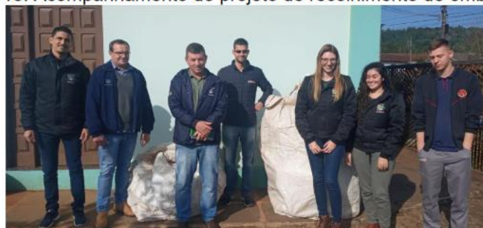
Figura 18: Acompanhamento do projeto de recolhimento de embalagens