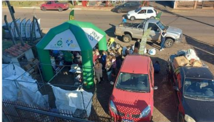
Figura 16: Acompanhamento da campanha do Ecopila com participação das Escolas

Prefeitura Municipal de Brochier CNPJ/MF: 91.693.309/0001-60 Rua Guilherme Hartmann, 260 – CEP: 95.790-000 Fone: 51 – 36971215 – Fax: 51 - 36971218 e-mail: fazenda@brochier-rs.gov.br // site: http://www.brochier.rs.gov.br/