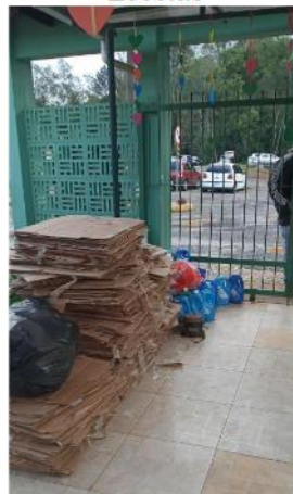
Figura 17: Acompanhamento do recolhimento de resíduos e troca por Ecopila nas Escolas