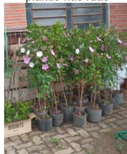
Figura 10: Mudas de árvores para plantio nas ruas