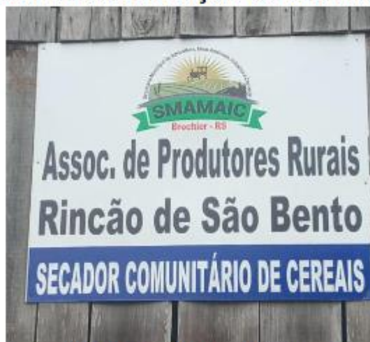
Figura 4: Placa de identificação do secador de Cereais

Secador de cereais em Rincão de São Bento, placa adquirida pela secretaria de Agricultura.