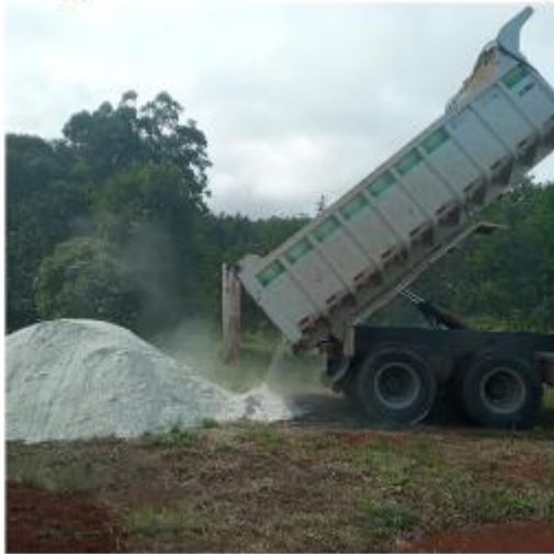
Figura 1: Descarregamento de calcário em propriedade rural