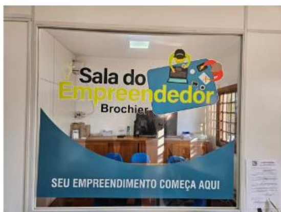
Figura 25: Sala do Empreendedor

Prefeitura Municipal de Brochier CNPJ/MF: 91.693.309/0001-60 Rua Guilherme Hartmann, 260 – CEP: 95.790-000 Fone: 51 – 36971215 – Fax: 51 - 36971218 e-mail: fazenda@brochier-rs.gov.br // site: http://www.brochier.rs.gov.br/