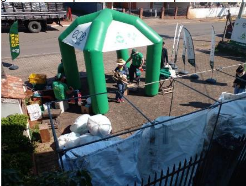
Figura 15: Acompanhamento da campanha do Ecopila