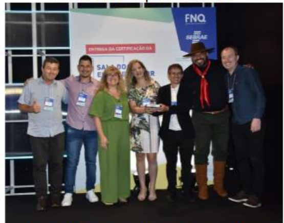
Figura 22: Entrega da certificação da Sala do Empreendedor