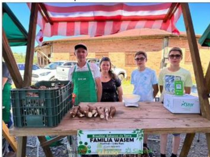
Figura 3: Feira de produtos no Sábado no Parque

Incentivo as agroindústrias e os agricultores familiares do município, que puderam expor e comercializar seus produtos nas feiras que aconteceram no Sábado no Parque e no Natal na Praça.