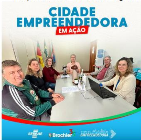
Figura 23: Promoção da Sala do Empreendedor via mídias digitais