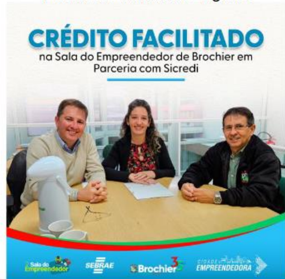
Figura 24: Promoção do Crédito Facilitado via mídias digitais